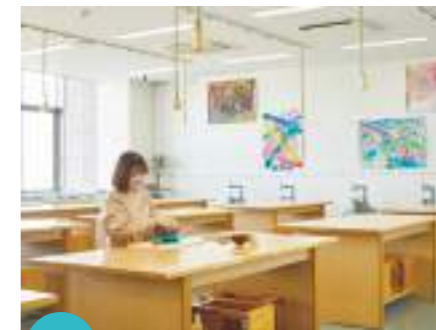
5F クラフトワーク室

IHとガスの学生用調理台を各5台設置。カメラで先生の手元を見ながら実習できるので、料理のスキルも向上します。