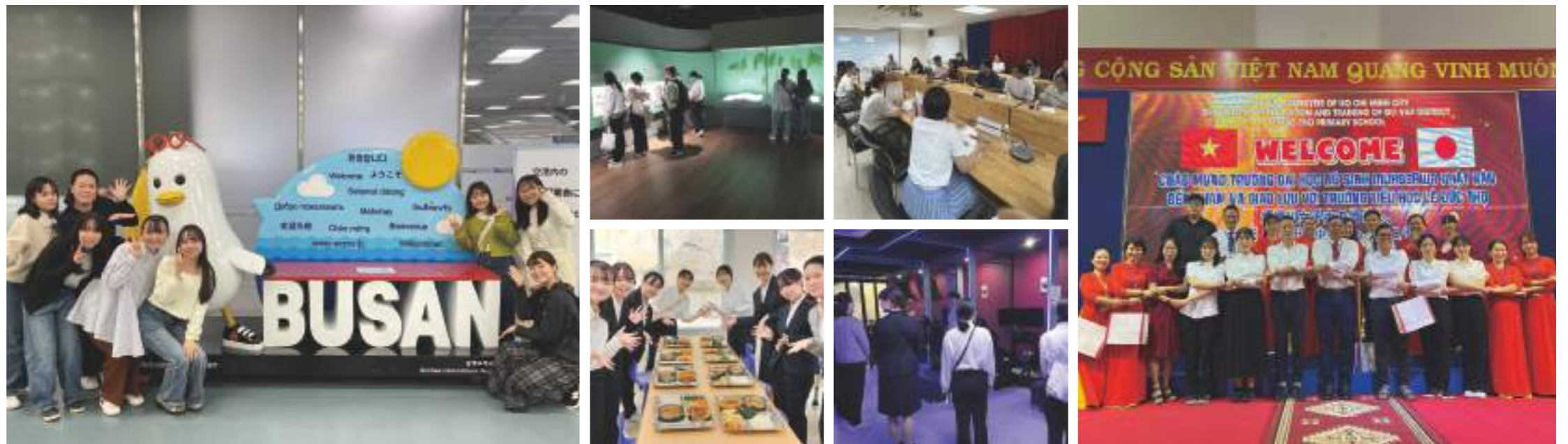
釜山研修(2024年度) ベトナム研修(2023年度)

教育フィールドワークの相手先を中心に、海外の大学や学校園の教員・学生が本学教育学科を訪問し、学内でも交流活動を行います。