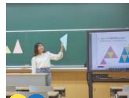
3F 6F 模擬小学校教室

デスクトップPCや教育関係の文献、教科書などが備えられています。それらを自由に使いながら、予習・復習はもちろん、模擬授業の相談やグループワークができるオープンスペースです。